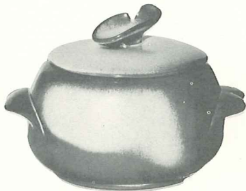
*4V—2 QT. BAKER/BEAN POT—5.50