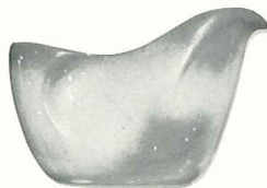
4A—8 OZ. CREAMER—2.00