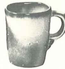
*5CC—5 OZ. TEACUP—1.50