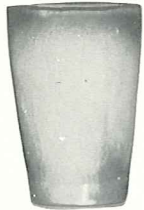
*5L—12 OZ. TUMBLER—2.00