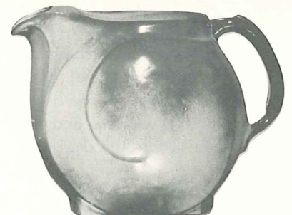
*4D—2 QT. PITCHER—5.00