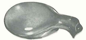
*4Y—6" SPOON HOLDER—1.50