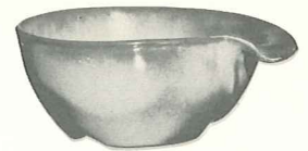
*4X—14 OZ. CEREAL—1.50