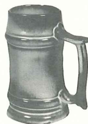
*M2—18 OZ. STEIN—2.50