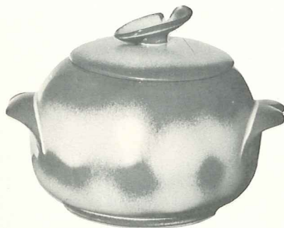
*4W—3 QT. BAKER/BEAN POT—7.00