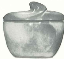
4B—SUGAR WITH LID—2.50