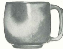
*4M—18 OZ. MUG—2.50