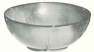
*224—8" ROUND BOWL—3.00