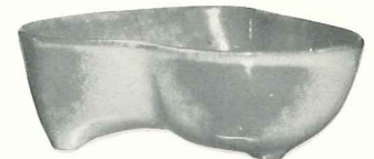
*4N—24 OZ. VEGETABLE—2.00